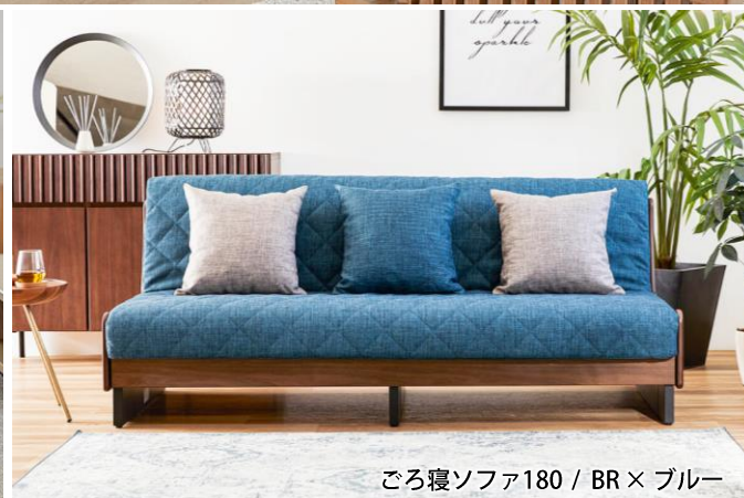
ごろ寝ソファ180 / BR × ブルー