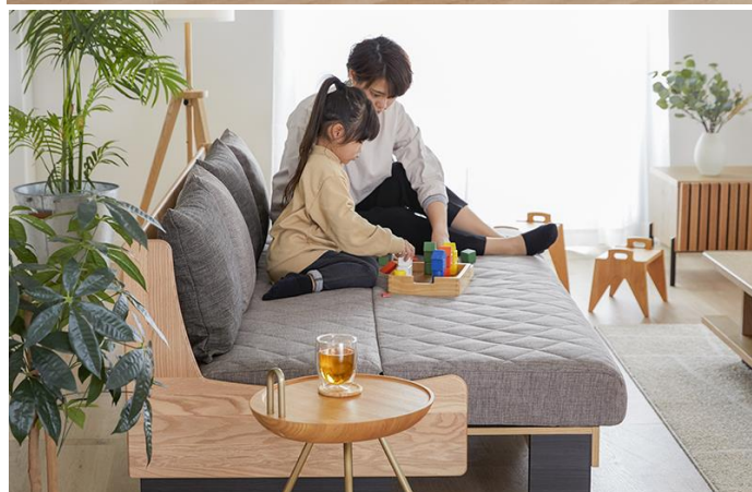
ごろ寝ソファ200 / NA × ライトグレー